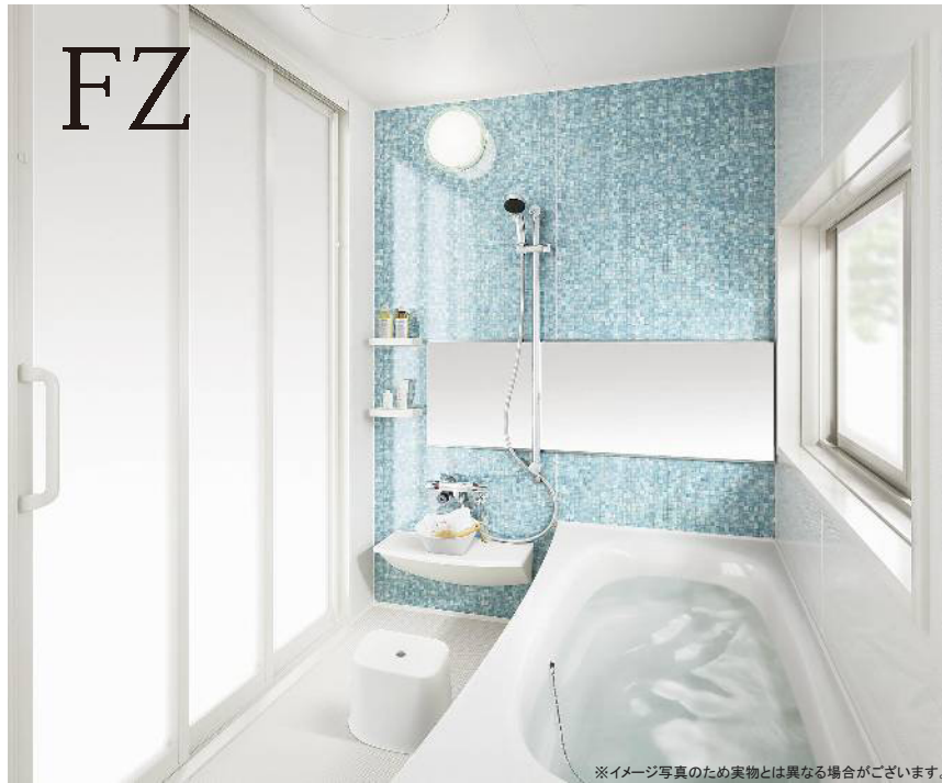
※イメージ写真のため実物とは異なる場合がございます。